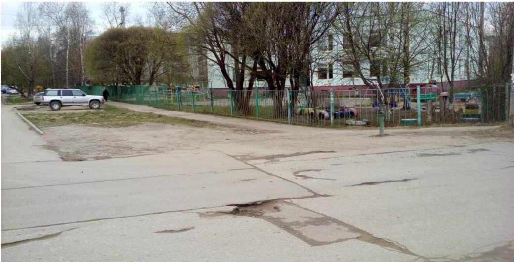
подход к центральному входу(перекресток улицы Ольговская и переулоч Ольговский)