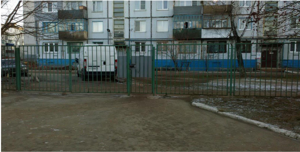
основной вход переулоч Ольговский