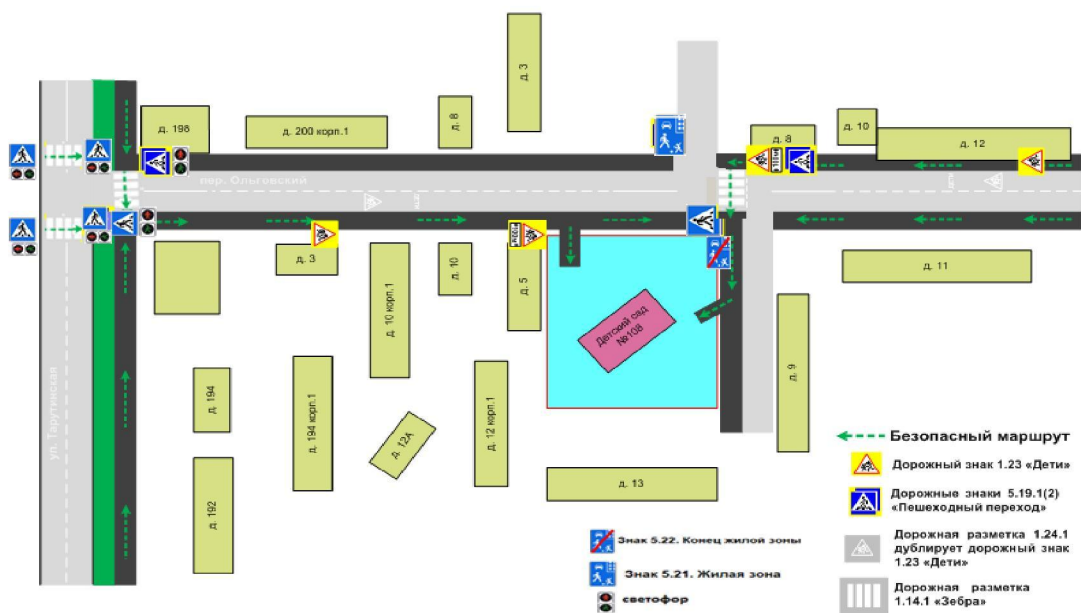
Пути движения транспортных средств к местам разгрузки/погрузки и рекомендуемые пути передвижения детей по территории МБДОУ №108 города Калуги